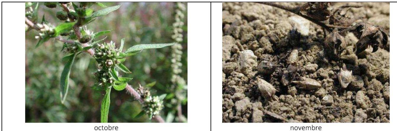
Ambrosie à feuilles d'armoise à différents stades de développement